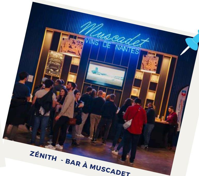
ZÉNITH - BAR À MUSCADET