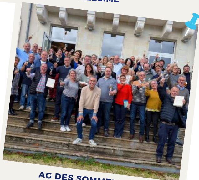
AG DES SOMMELIERS FORMATEURS